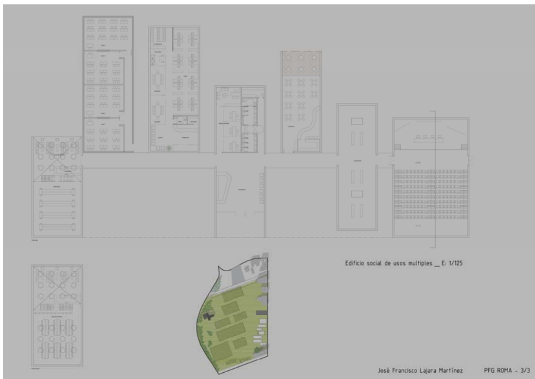
Figs. 5.3.- y 5.3.- Elementos de análisis y de propuesta de José Fco. Lajara (Pre-entrega PFC)